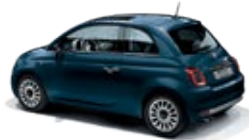
687 Dipinto di blu Blau