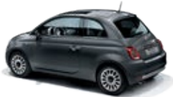
695 Pompei Grau