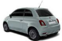
196 Rugiada Grün