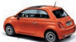
562 Spritz Orange