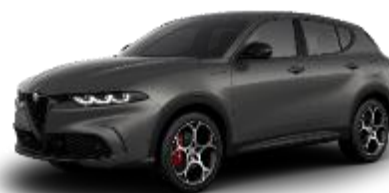
851 - Grigio Vesuvio