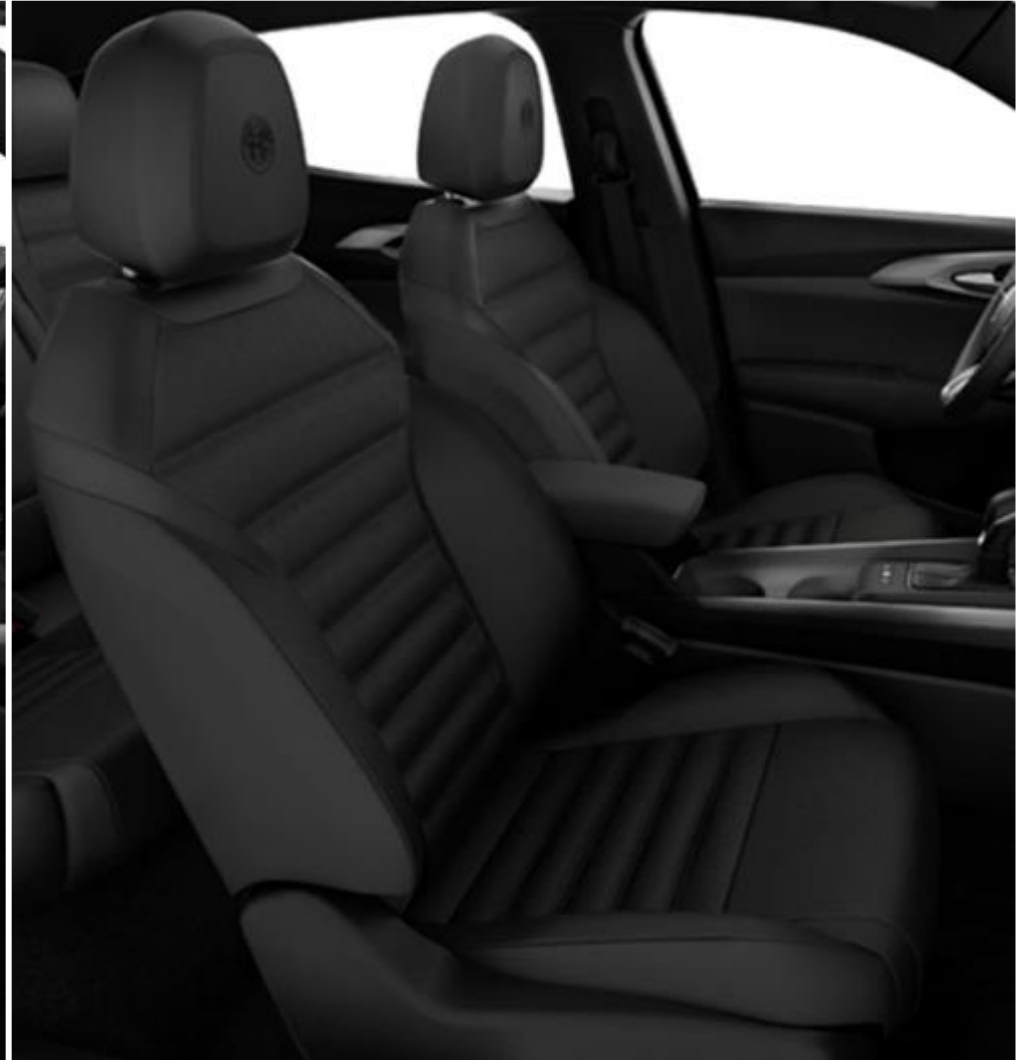
PACK LEATHER & PACK PREMIUM Schwarzes perforiertes Leder (cod. 428)