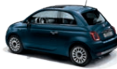
687 Dipinto di blu Blau