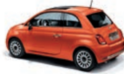
562 Spritz Orange