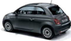
695 Pompei Grau