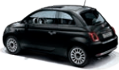
876 Vesuvio Schwarz