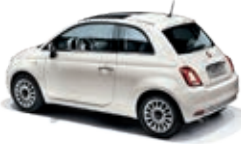
268 Gelato Weiss