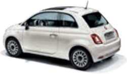
268 Gelato Weiss