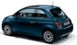
687 Dipinto di blu Blau