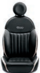
Leder Schwarz/Elfenbein 686/687