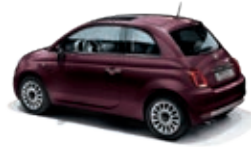
866 Opera Bordeaux