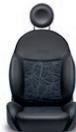
Sequal™ Schwarz 280/337