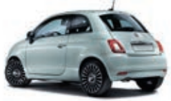
196 Rugiada Grün