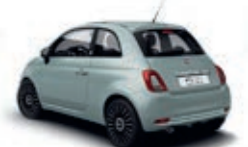
196 Rugiada Grün