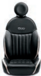
Leder Schwarz/Elfenbein 686/687