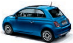
425 Italia Blau