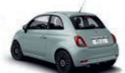
196 Rugiada Grün