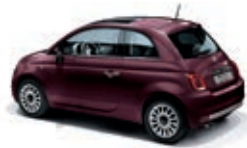
866 Opera Bordeaux