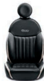
Leder Schwarz/Elfenbein 598