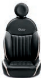
Leder Schwarz/Elfenbein 686/687