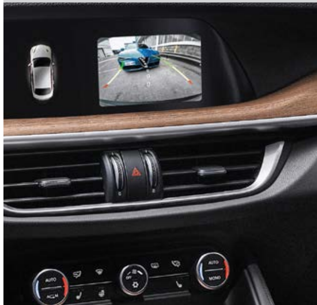
RÜCKFAHRKAMERA MIT DYNAMISCHEN FÜHRUNGSLINIEN