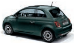
421 Grün Portofino Matt