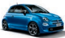
425 Italia Blau