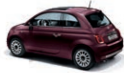
866 Opera Bordeaux