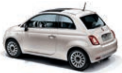
494 Pulverrosa Stella