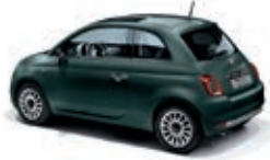
421 Rockstar Grün Matt