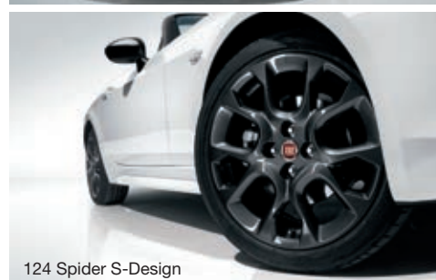
124 Spider S-Design