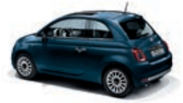
687 Dipinto di blu Blau