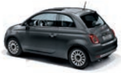
695 Pompei Grau