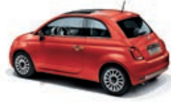
552 Corallo Rot