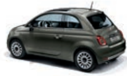
372 Colosseo Grau