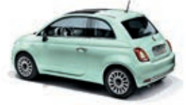
166 Lattementa Grün