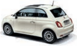
227 Ghiaccio Weiss