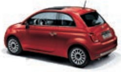
111 Passione Rot