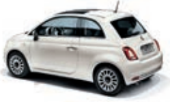
268 Gelato Weiss