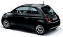
876 Vesuvio Schwarz