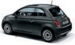
735 Carrara Grau