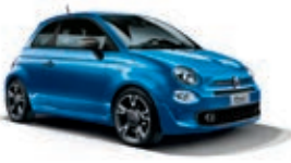
425 Italia Blau