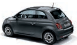
695 Pompei Grau