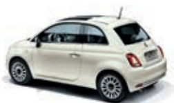
227 Ghiaccio Weiss