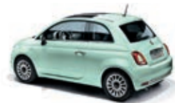
166 Lattementa Grün