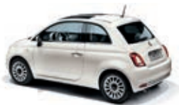
268 Gelato Weiss