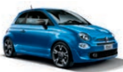
425 Italia Blau