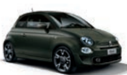
149 Alpen-Grün Matt (mit 6U9)