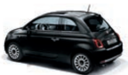
876 Vesuvio Schwarz