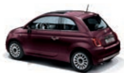
866 Opera Bordeaux