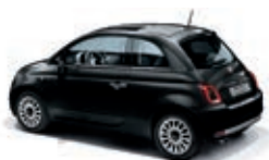
876 Vesuvio Schwarz