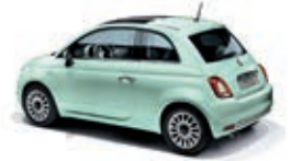
166 Lattementa Grün