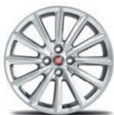
124 Spider Lusso