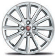
124 Spider Lusso